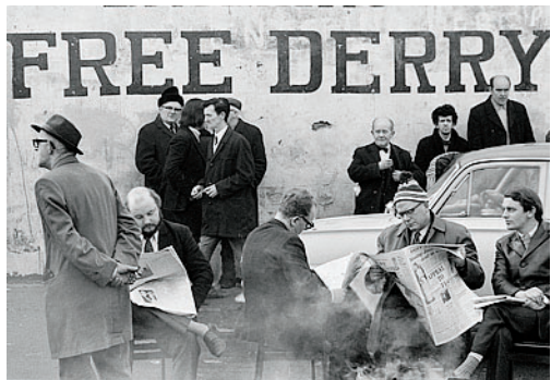
Contraddizioni In alto: un bambino dopo il Bloody Sunday. Sopra, da sinistra: irlandesi a Derry e due ragazze a Londra negli anni 60

ture che, senza confronto e senza discussione, nella liberale Inghilterra ha fatto ritirare dal commercio il libro «London by Gian Butturini» e infangato la figura di un uomo che per tutta la vita si era impegnato contro ogni forma di razzismo e d'ingiustizia». La rassegna da Still presenta cinquanta scatti, tratti da due dei libri più famosi dell'autore — quello messo all'indice e «Dall'Irlanda dopo London-